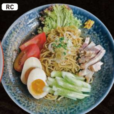
RC 冷やし中華 Cold Noodle