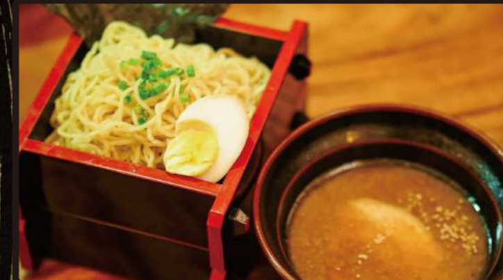
RD 醤油つけ麺 Dipping Noodle Soy Sauce