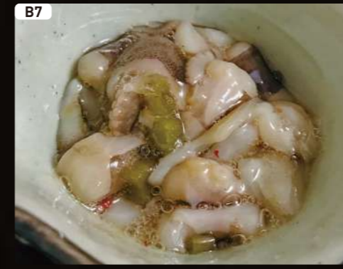
B7 タコワサ Octopus Dressed with WASABI $3.00