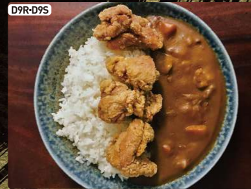
D9R-D9S ざんぎカレー (大or小) Curry Bowl with Deep Fried Chicken R $5.50 S $3.25