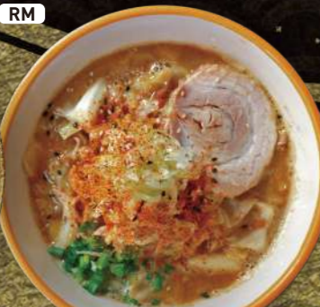
RM 北海道 味噌野菜ラーメン MISO Vegetable Ramen