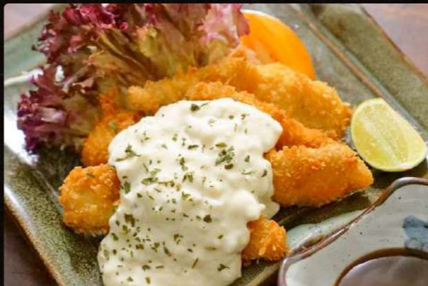
A9 南国鯛フライのタルタル $4.50 Deep Fried Nangoku Tai Fish with Tartar Sauce