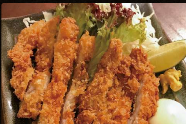
T01 とんかつ $4.25 TONKATSU Pork Cutlets