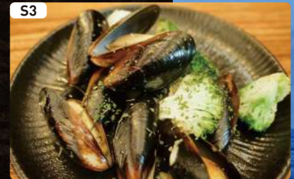
S3 ムール貝のワイン塩蒸し Steamed Mussels with Wine and Salt $4.75