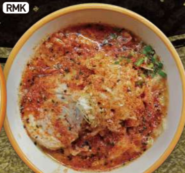
RMK 北海道 辛味噌野菜ラーメン Spicy MISO Vegetable Ramen