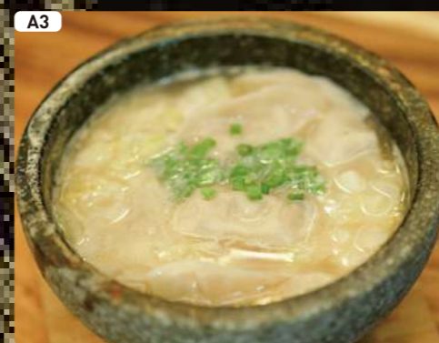
A3 豚骨炊き餃子 Pork Soup Dumpling $4.00