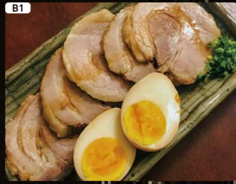
B1 チャーシューと煮卵 Roast Pork & Seasoned Egg $3.00