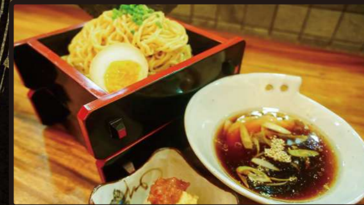
RDP 鶏から梅おろしつけ麺 Dipping Noodle Chicken & Plum