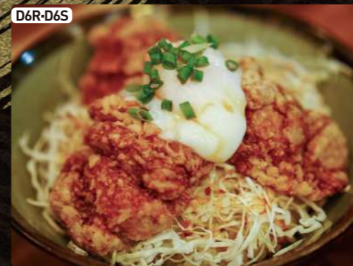
D6R-D6S ざんぎ丼 (大or小) Fried Chicken Bowl R $5.50 S $3.25