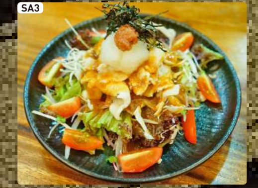
SA3 梅おろし豚しゃぶサラダ Pork Shabu Salad with Plum $4.50