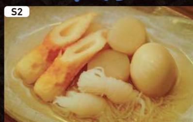
S2 塩おでん Salt ODEN $3.50