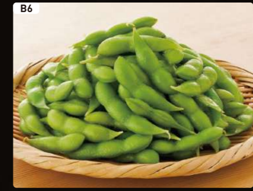
B6 枝豆 Green Soy Bean $2.75