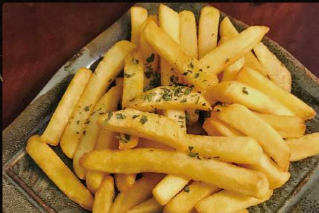
A15 フライドポテト $2.75 French Fried