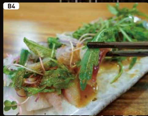
B4 南国鯛のカルパッチョ Carpaccio of NANGOKU-TAI Fish $4.25