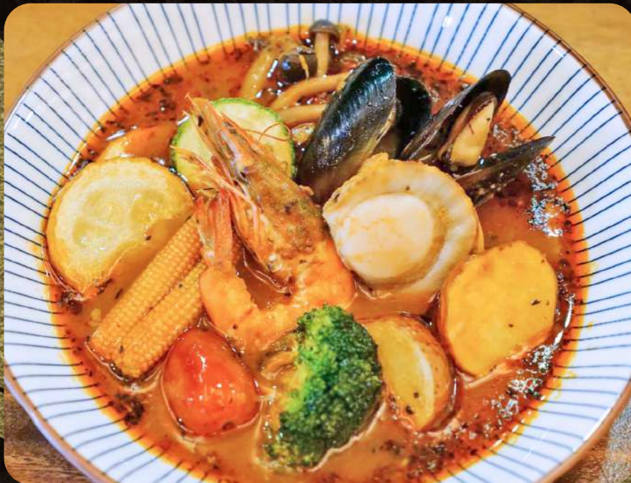
C3 北海道シーフードスープカレー $8.25 Seafood Soup Curry with Rice