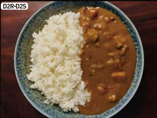
D2R-D2S カレーライス (大or小) Japanese Curry Bowl R $4.00 S $2.50