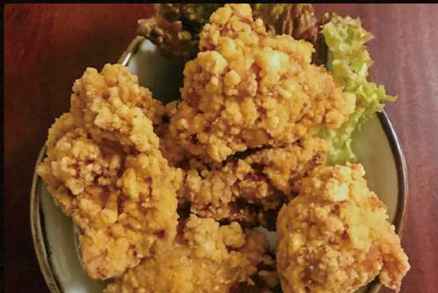
A12 北海道ざんぎ $3.75 Curry Dipping Noodle