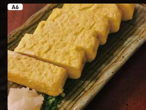
A6 だし巻き卵焼き Japanese Omelette $3.50