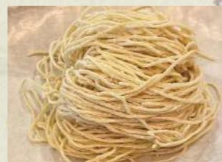
Thin Noodle 細ストレート麺。

You Can choose Noodle from 2types Wide or Thin.