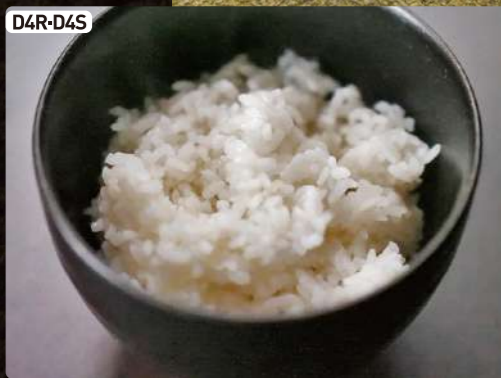
D4R-D4S ご飯 (大or小) Steamed Rice R $2.00 S $1.00