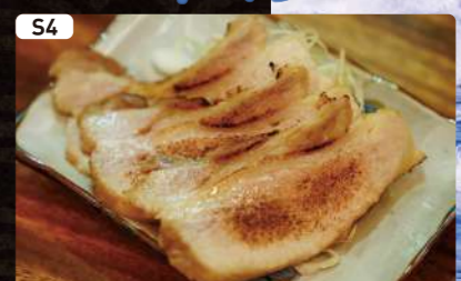
S4 炙り塩チャーシュー Grilled Salted Pork $2.50