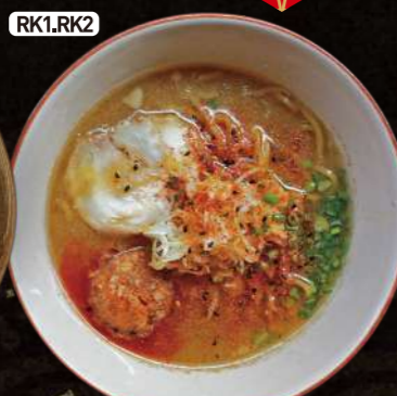
RK1.RK2 ピリ辛ラーメン (塩or醤油) Spicy Ramen