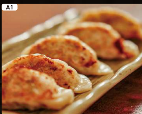
A1 餃子 Dumpling $2.75