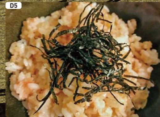
D5 明太バターご飯 Cod Roe Butter Rice $2.50