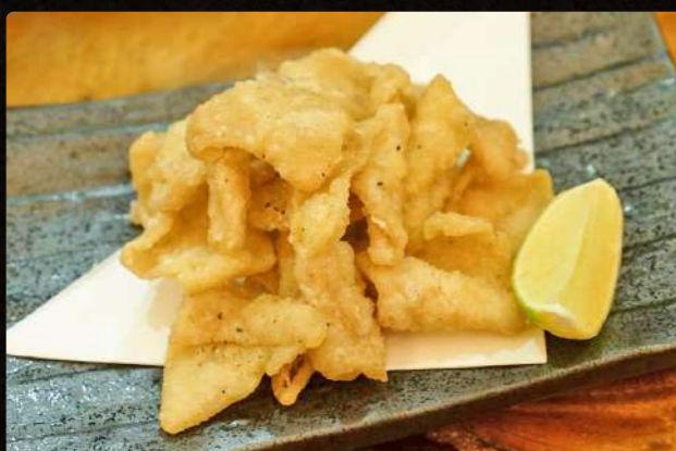
F1 鶏皮せんべい $3.50 Deep Fried Chicken Skin