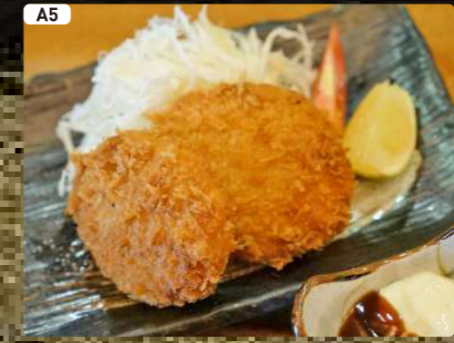
A5 カニクリームコロッケ Crab Cream Croquette $4.50