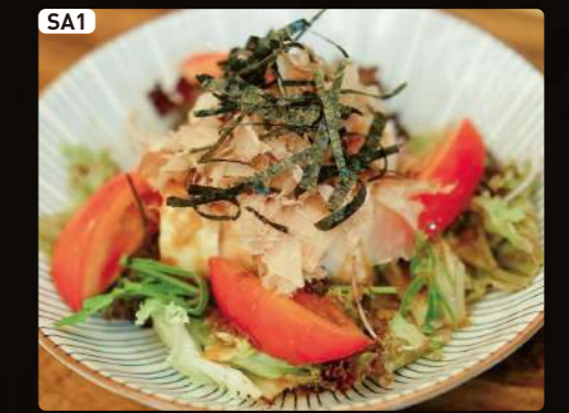
SA1 とうふサラダ Tofu Salad $4.50