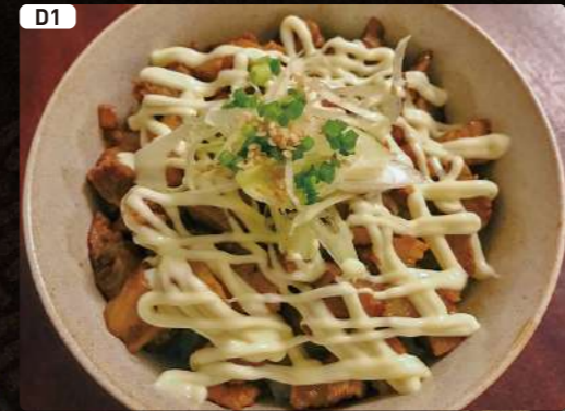
D1 ミニチャーマヨ丼 Mini Roasted Pork Bowl $2.50