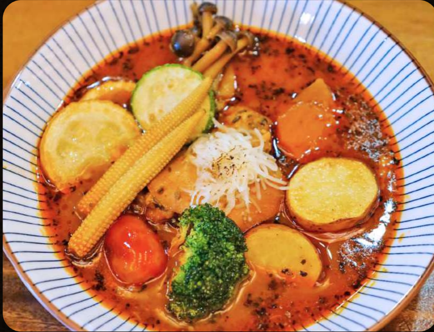
C1 北海道チキンスープカレー $7.50 Chicken Soup Curry with Rice