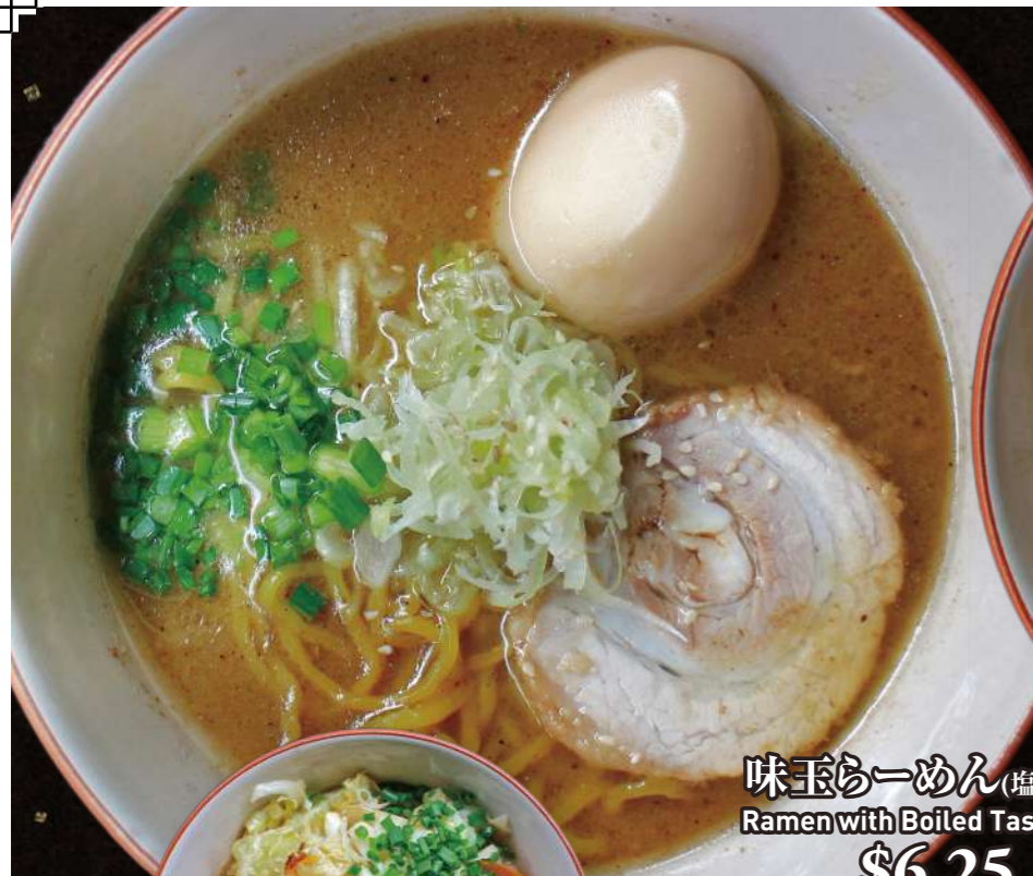
味玉らーめん (塩or醤油) Ramen with Boiled Tasted Egg

You can choose the amount of noodles in our shop. Prices are same until 3 TAMA!