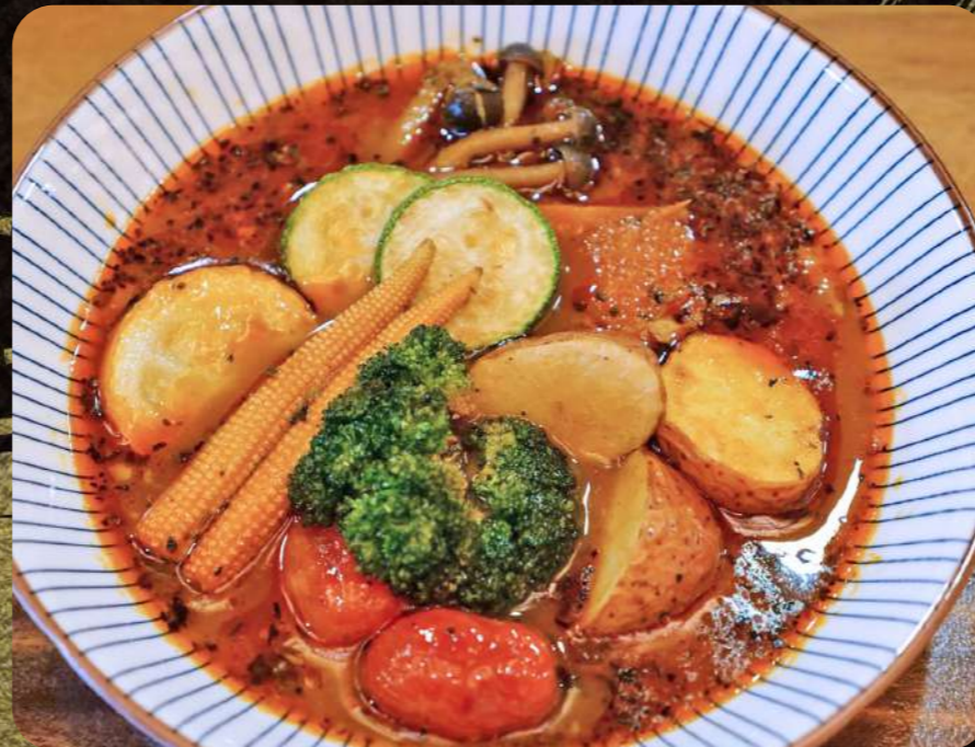
C4 北海道ベジタブルスープカレー $7.00 Vegetable Soup Curry with Rice