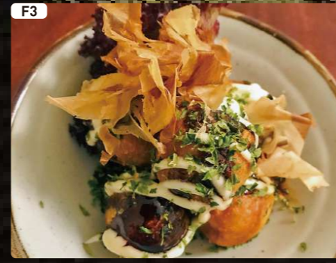
F3 揚げたこ焼き TAKOYAKI $3.50