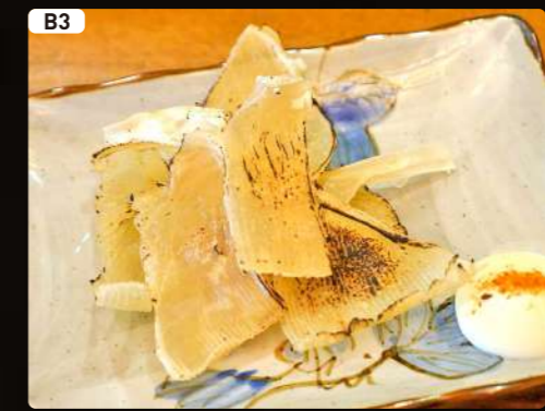
B3 炙りエイヒレ Grilled Ray Fin $3.50