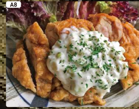
A8 チキン南蛮 Fried Chicken with Vinegar & Tartar Sauce $5.00