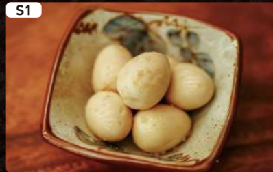
S1 うずらの煮卵燻製塩 Seasoned Quail Eggs with Smoked Salt $1.75