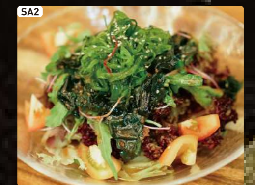
SA2 海藻サラダ Seaweed Salad $4.50