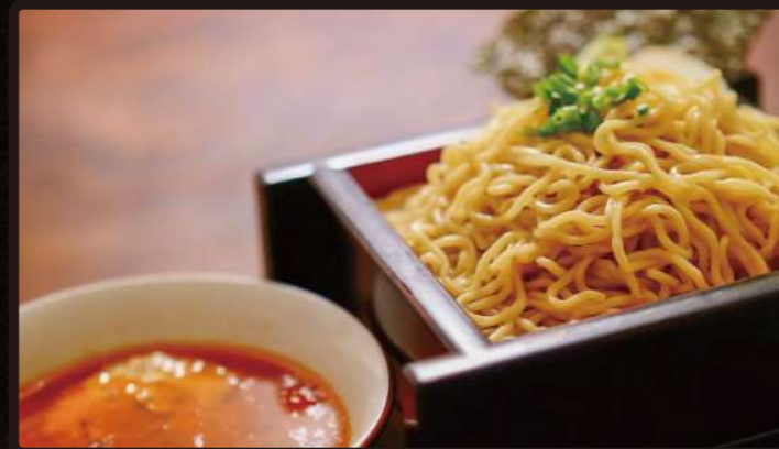
RDB 四川風坦々つけ麺 Spicy TANTAN Dipping Noodle