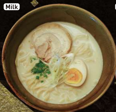
北海道牛乳ラーメン HOKKAIDO Milk Ramen