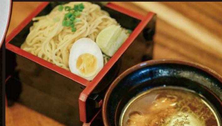
RDC カレーつけ麺 Curry Dipping Noodle