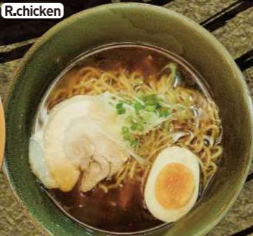
R.chicken 鶏がらさっぱり 醤油ラーメン Chicken Soup Ramen Soy Sauce