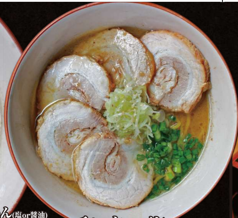
チャーシューメン Roast Pork Ramen