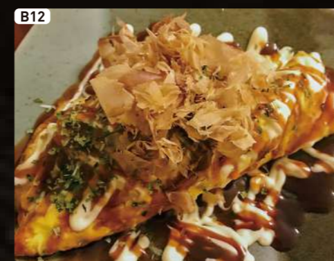
B12 豚平焼き OSAKA Style Omlette $4.25