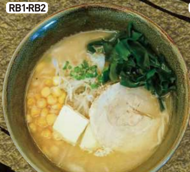
RB1-RB2 わかめバター コーンラーメン (塩or醤油) Wakame Butter Corn Ramen