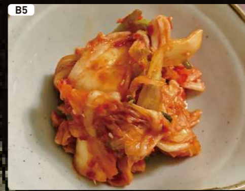
B5 キムチ Kimchi $2.00