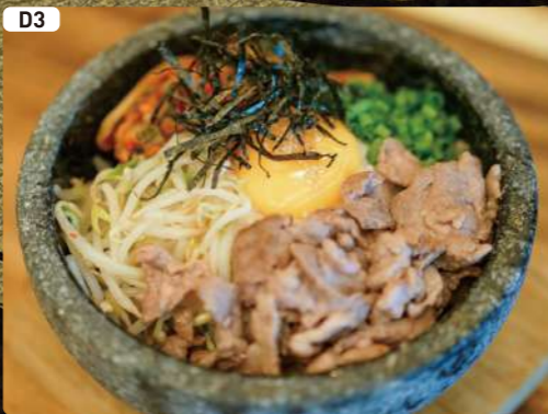
D3 石焼ラムビビンバ Stone Grilled Lamb BIBIMBAP $6.00