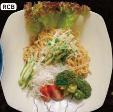
RCB ベジタリアン冷やし中華 Vegetarian Cold Ramen