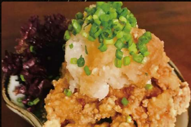
A11 北海道ざんぎおろしポン酢 $4.25 Deep Fried Chicken PONZU Sauce