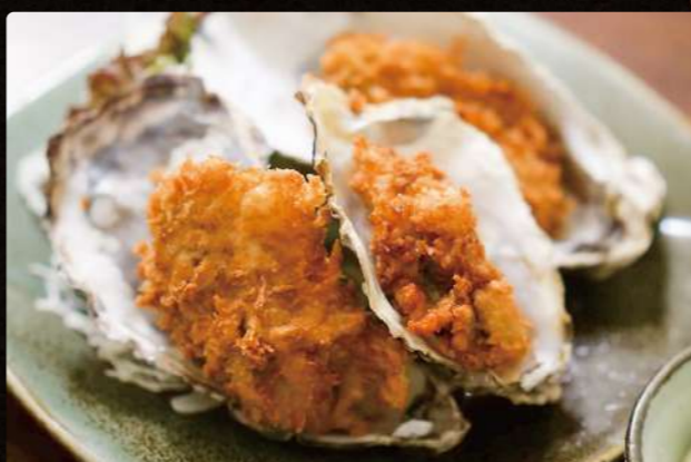
A13 カキフライ $5.50 Deep Fried Oyster