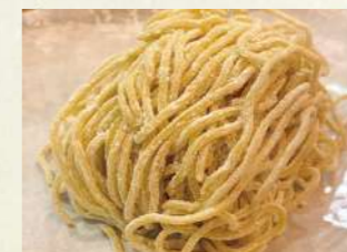
Original Noodle シャングリラ自慢、中太麺。