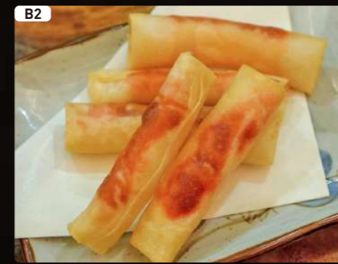
B2 明太チーズ春巻き Spring Roll Cheese & Cod Roe $3.00