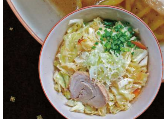
RY1.RY2 野菜ラーメン (塩or醤油) Vegetable Ramen