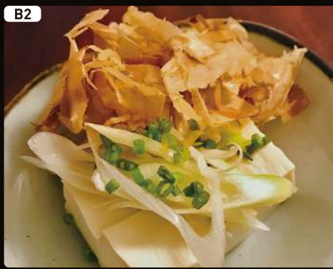
B2 冷奴 Cold TOFU $2.75