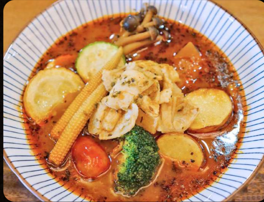
C2 北海道ポークスープカレー $7.50 Pork Soup Curry with Rice