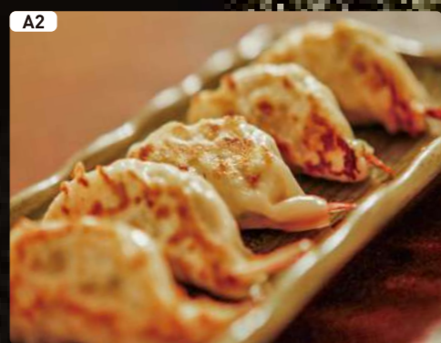
A2 海老餃子 Shrimp Dumpling $3.75