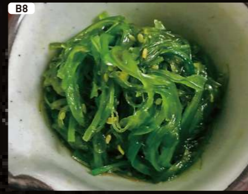
B8 中華わかめ CHUKA WAKAME $2.50