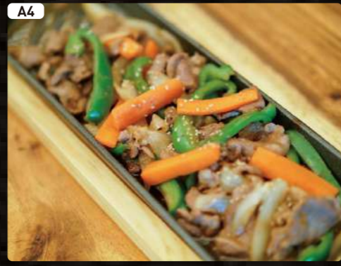
A4 鉄板ラムジンギスカン HOKKAIDO Style Lamb BBQ $5.50