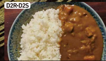
D2R-D2S カレーライス(大or小) $4.00 $2.50 Japanese Curry Bowl