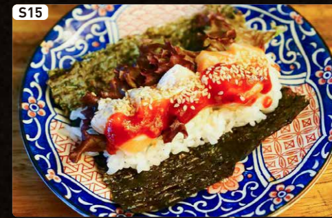
S15 スパイシーサーモン Spicy Salmon $1.90