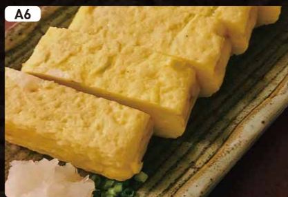
A6 だし巻き卵焼き Japanese Omelette $3.50