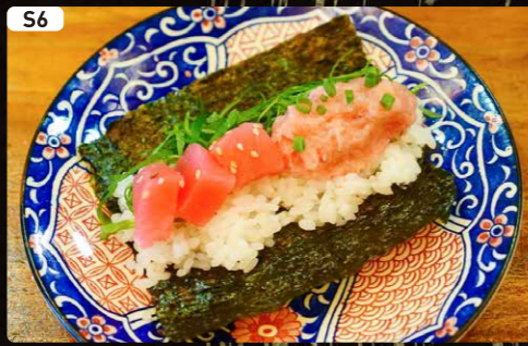
S6 マグロ2種盛り Tuna & Negitoro $1.90