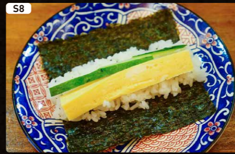
S8 玉子 Japanese Omelette $1.00