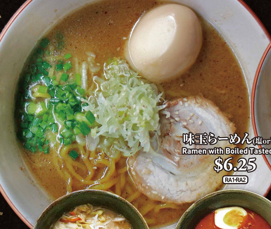
味玉ラーメン(塩or醤油) Ramen with Boiled Tasted Egg $6.25 RA1-RA2