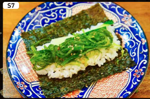
S7 中華わかめ CHUKA WAKAME $1.00