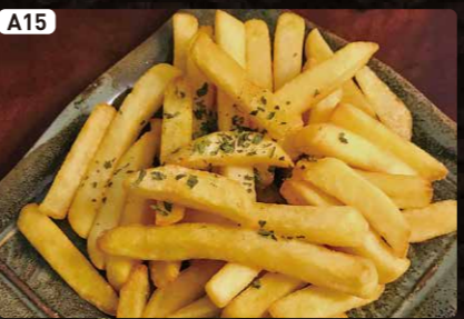
A15 フライドポテト French Fried $2.75