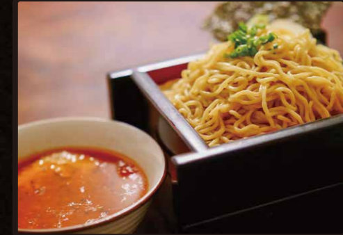
RDD 四川風坦々つけ麺 $7.70 Spicy TANTAN Dipping Noodle