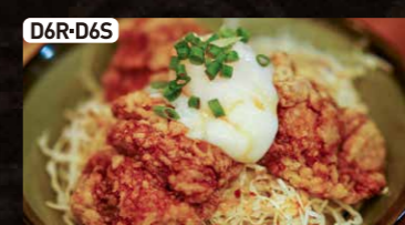
D6R-D6S ざんぎ丼(大or小) $5.50 $3.25 Fried Chicken Bowl