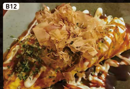
B12 豚平焼き OSAKA Style Omelette $4.25