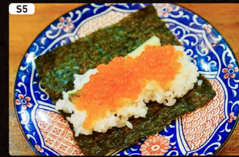
S5 いくら Salmon Roe $1.90