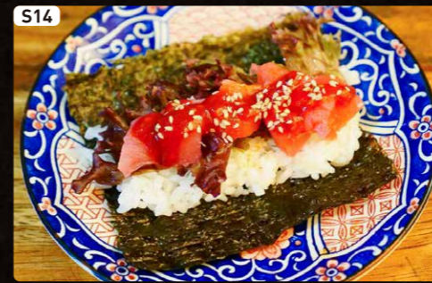
S14 スパイシーツナ Spicy Tuna $1.90