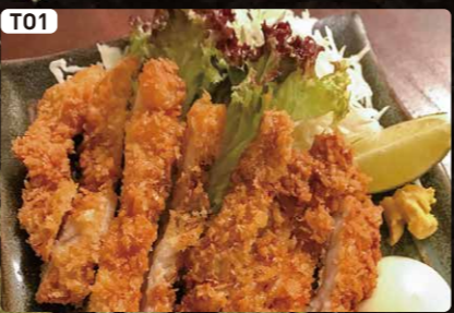
T01 とんかつ TONKATSU Pork Cutlets $4.25