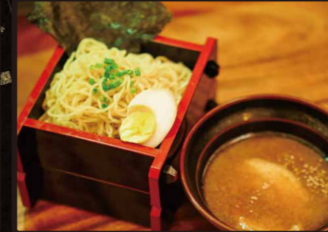
RD 醤油つけ麺 $6.25 Dipping Noodle Soy Sauce