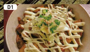
D1 ミニチャーマヨ丼 $2.50 Mini Roasted Pork Bowl