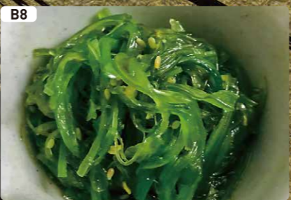
B8 中華わかめ CHUKA WAKAME $2.50