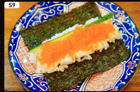
S9 とびっこ TOBIKO $1.50