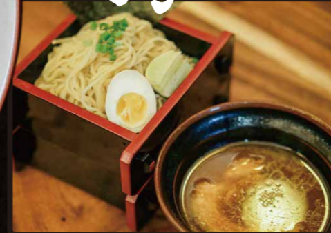
RDC カレーつけ麺 $7.25 Curry Dipping Noodle