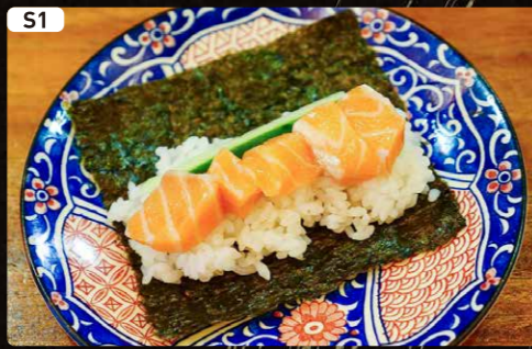
S1 サーモン Salmon $1.90