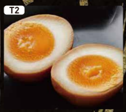
T2 味玉 $1.00 Seasoned Egg