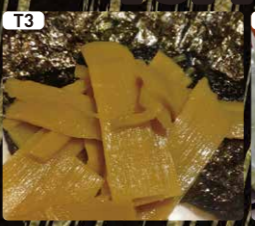
T3 メンマ&海苔 $1.50 Bamboo & Toasted laver