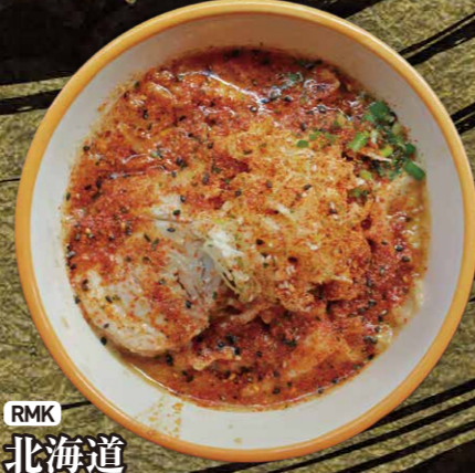
RMK 北海道辛味噌野菜ラーメン $7.25 Spicy MISO Vegetable Ramen