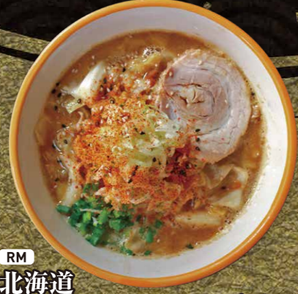
RM 北海道味噌野菜ラーメン $6.75 MISO Vegetable Ramen