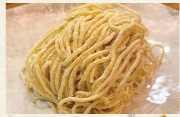
Original Noodle シャングリラ自慢、中太麺。 モチモチで歯切れの良いこちらは濃い目の味噌や、つけ麺と相性ばっちりです。