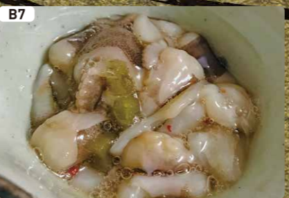
B7 タコワサ Octopus Dressed with WASABI $3.00