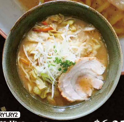
RY1.RY2 野菜ラーメン(塩or醤油) Vegetable Ramen $6.25