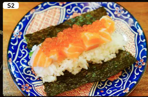
S2 いくらサーモン Salmon & Salmon Roe $1.90