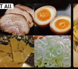
TALL 全部のせ $4.50 Put All