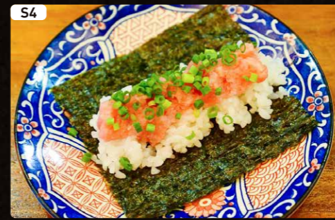
S4 ネギトロ NEGITORO $1.90