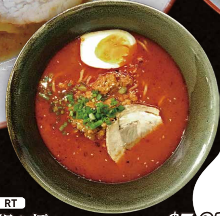
RT 担々麺 $7.25 Szechuan Style Sesame Hot Noodles