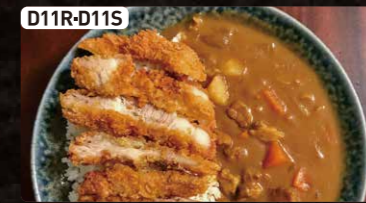
D11R-D11S かつカレー(大or小) $5.50 $3.25 Curry Bowl with Pork Cutlet