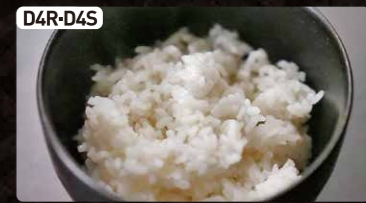
D4R-D4S ご飯(大or小) $2.00 $1.00 Steamed Rice