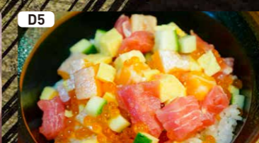
D5 ミニ海鮮丼 $0.00 Mini Seafood Bowl