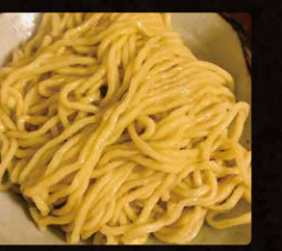
大盛、替え玉 $1.5 Large Size or One More Noodle