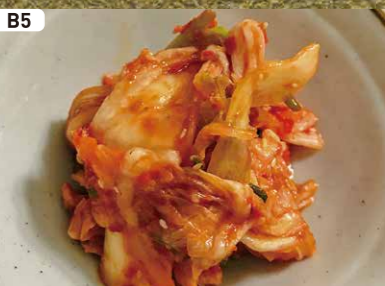
B5 キムチ Kimchi $2.00