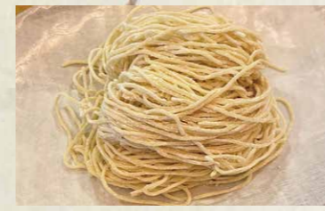
Thin Noodle 細ストレート麺。 小麦の香りが強くて歯ごたえのある歯切れの良い食感です。

細ストレート麺・中太麺からお選び頂けます。 You Can choose Noodle from 2types Wide or Thin.