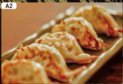
A2 海老餃子 Shrimp Dumpling $3.75