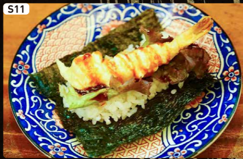
S11 海老天 Shrimp TEMPURA $1.90