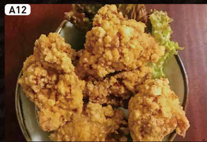
A12 北海道ざんぎ Deep Fried Chicken $3.75