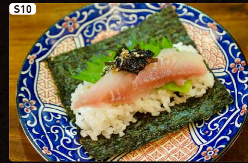
S10 南国鯛と塩昆布 XXXXXXXXXXXXX $1.00