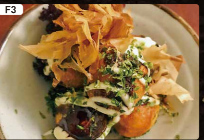
F3 揚げたこ焼き TAKOYAKI $3.50