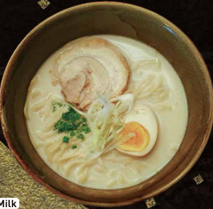
Milk 北海道牛乳ラーメン $6.25 HOKKAIDO Milk Ramen