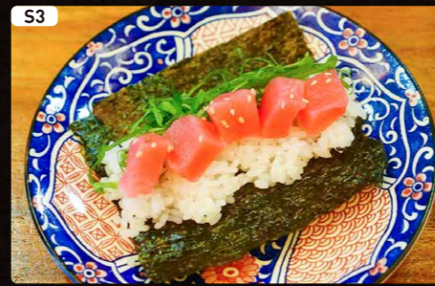
S3 マグロ Tuna $1.90