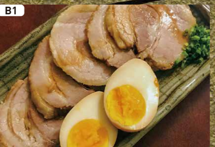
B1 チャーシューと煮卵 Roast Pork & Seasoned Egg $3.00