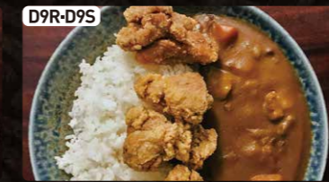
D9R-D9S ざんぎカレー(大or小) $5.50 $3.25 Curry Bowl with Deep Fried Chicken