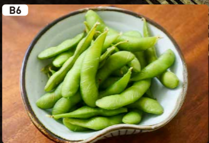
B6 枝豆 Green Soy Bean $2.75