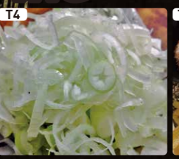
T4 ネギ $1.00 White Leek