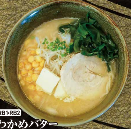
RB1-RB2 わかめバターコーンラーメン(塩or醤油) Wakame Butter Corn Ramen $6.25