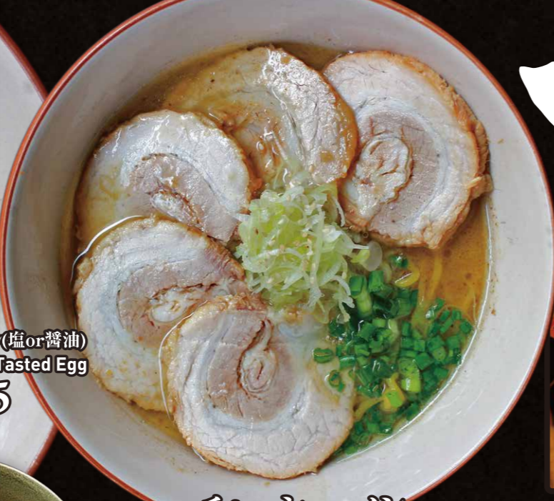
チャーシューメン Roast Pork Ramen $7.25 RP