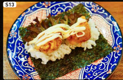
S13 唐揚げマヨ Deep Fried Chicken & Mayonnaise $1.50