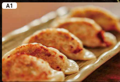
A1 餃子 Dumpling $2.75