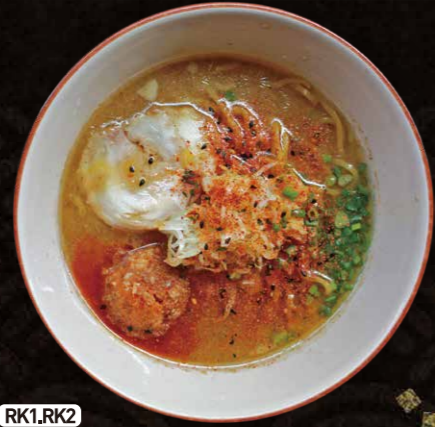
RK1.RK2 ピリ辛ラーメン(塩or醤油) Spicy Ramen $6.25