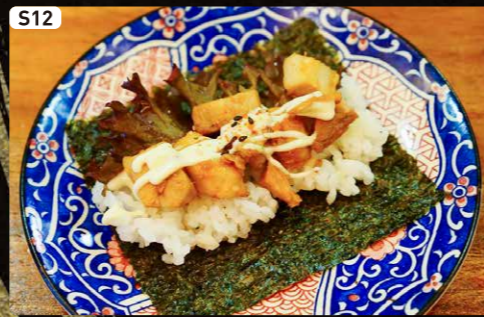
S12 チャーシューマヨ Roasted Pork & Mayonnaise $1.25